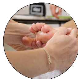
5. MASSAGE AVEC CRÈME