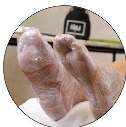
2. ENVELOPPE ET POSE