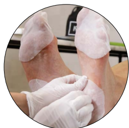
1. APPLICATION DES PATCHS