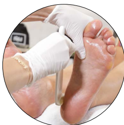
3. ENLEVEMENT DE LA CALLOSITÉ